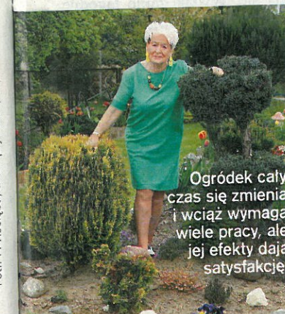
Ogródek cały czas się zmienia i wciąż wymaga wiele pracy, ale jej efekty dają satysfakcję.

teraz z koleżankami, zaprzyjaźnionymi działkowcami, rodziną.